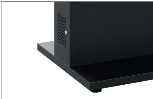
Lüftungsöffnungen sorgen für effektive Wärmeabfuhr

Durch Zusatzoptionen lässt sich die Stele zudem für den gewünschten Einsatzort individuell anpassen.