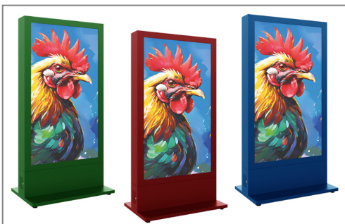
Optional auch in einem RAL-Ton nach Wunsch