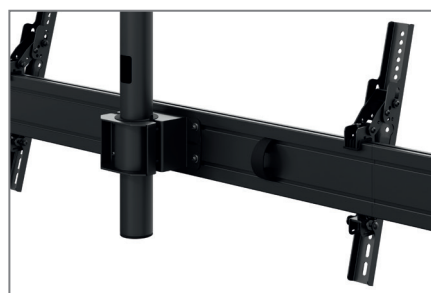
Anpassbar dank modularer Bauweise