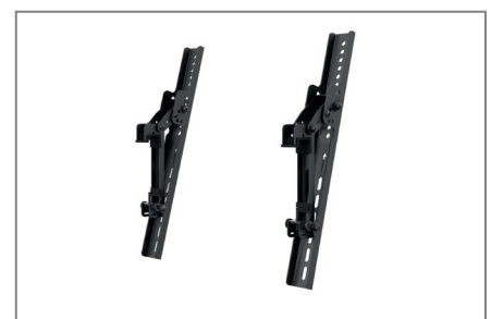
VESA max. 600 x 400 mm