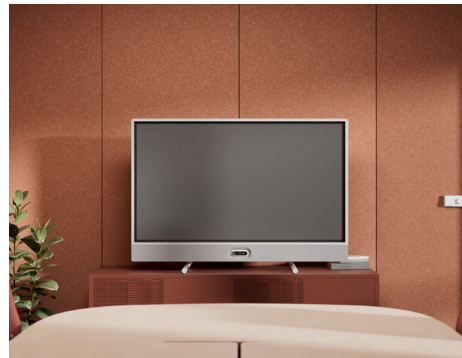
Tischstativ mit Kamera unten