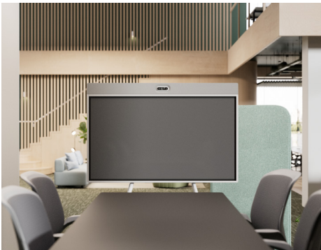
Wagen mit Kamera oben