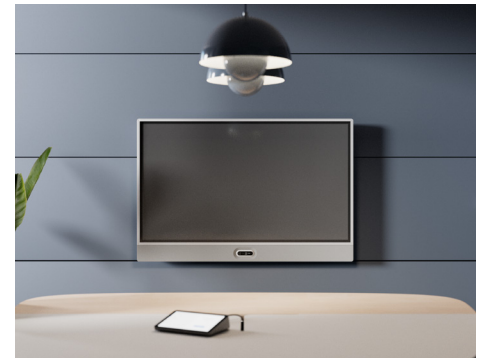
Wandhalterung mit Kamera unten

Das flexible Rally Board 65 ist perfekt für Ihre Meetings. Es funktioniert nahtlos mit führenden Plattformen wie Microsoft Teams, Zoom und Google Meet* in Android, PC oder BYOD-Modus, sodass Sie Rally Board 65 problemlos an aktuelle und zukünftige Anforderungen anpassen können. Außerdem bietet es mehrere Montagemöglichkeiten**, sodass Sie es in jedem offenen Raum oder Konferenzraum verwenden können. Es ist so konzipiert, dass die Kamera über oder unter dem Bildschirm angebracht werden kann, damit alle Teilnehmer in allen Räumen natürlichen Blickkontakt halten können.