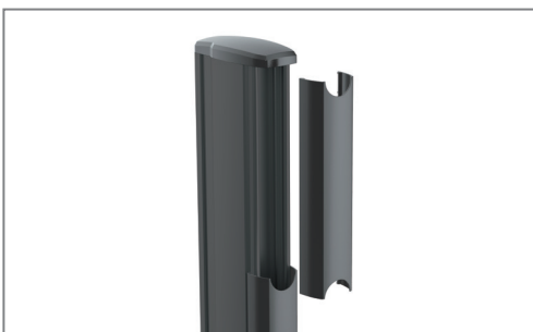
Verdeckte Kabelführung, rückseitig entlang der Pillars