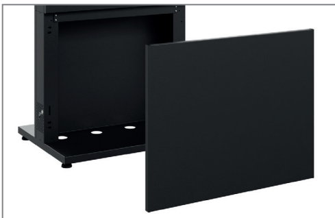
Abnehmbares Frontcover für gute Servicezugänglichkeit

Durch Zusatzoptionen lässt sich die Stele zudem für den gewünschten Einsatzort individuell anpassen.