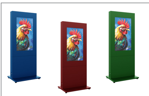
Optional auch in einem RAL-Ton nach Wunsch