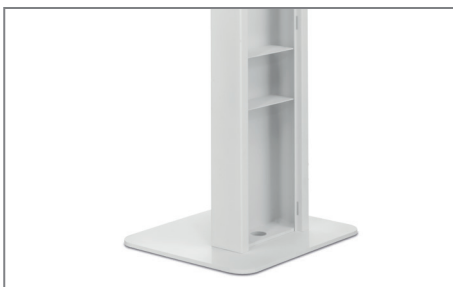
Kabelzuführung auch durch die Bodenplatte möglich