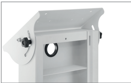
Bildschirmaufnahme, 0 - 90° neigbar

Im Standard ist die die Oberfläche der vis-it Tilt 22 - 43" White mit einer schlag- und kratzfesten Pulverbeschichtung in weiß veredelt. Weitere RAL-Farben sind auf Anfrage möglich.