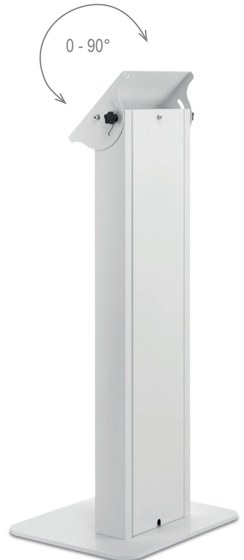
Bildschirm nicht im Lieferumfang enthalten